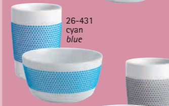
26-431 cyan blue