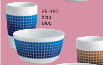
26-450 blau blue