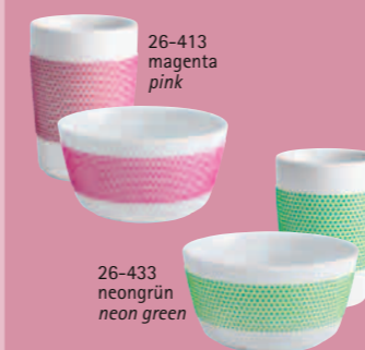
26-413 magenta pink