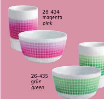
26-434 magenta pink